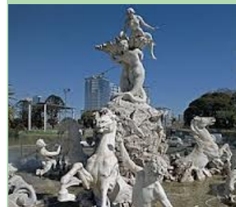
La Fuente de las Nereidas

que se alza al cielo como una promesa de libertad, debió estar en Plaza de Mayo, dado que se construyó como homenaje a la Revolución de 1810. Tuvo que ser movida a la Costanera Sur, en ese momento un lugar ignoto de la ciudad, porque las damas de la época consideraron que era indecente poner figuras desnudas frente a la Catedral. Varios intentos contemporáneos de mover la fuente fracasaron, así que quedó donde fue relegada. Sin embargo, su espíritu de libertad surge del agua al cielo.