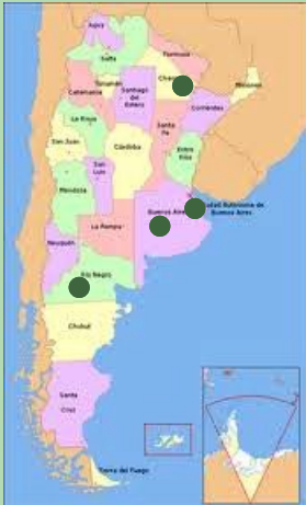
Lugares de donde son oriundos los graduados que reciben sus diplomas en noviembre de 2012