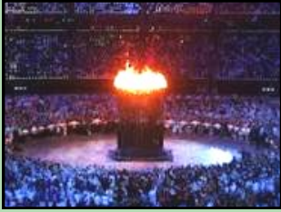
Compartimos la llama