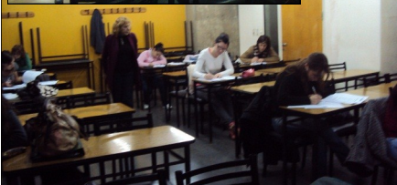
Exámenes de alumnos de Capital