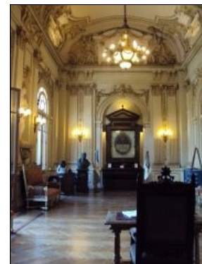
Salón de la Bandera Palacio de Gobierno, Jujuy.

La modalidad virtual y las comunidades que se establecen a través de ella están colmadas de vivencias y valores inherentes a cualquier espacio donde ocurren las interacciones humanas. En virtud de esto, el Área de EaD desea, en este aniversario, que los valores que sustentó el Gral. Belgrano nos inspiren a todos los argentinos.