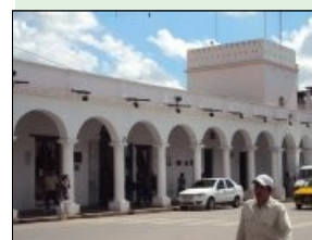
Cabildo de Jujuy. Desde un piso superior que ya no existe, el Gral. Belgrano mostró por primera vez la bandera al pueblo y a la tropa reunidos en la plaza.