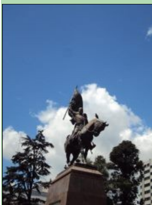
General Manuel Belgrano y sus colores eternos. San Salvador de Jujuy.