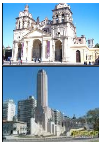
Nuestra oferta educativa llegará a más ciudades a través del CEYFE.

A mediados del 2011, la Universidad CAECE, a través del Área de Educación a Distancia, firmó un convenio para que el CEYFE pase a ser Subcentro de Apoyo Remoto en diversas ciudades de nuestro país. Esta vinculación ha permitido que las diferentes ofertas del Área, como ser las Licenciaturas para profesores y Diplomaturas lleguen a mayor número de interesados en estudiar con esta modalidad de aprendizaje. Esta nueva colaboración funcionará en los centros que el CEYFE posee en Rosario, Córdoba capital, Alejo Ledesma, Embalse, Esquel, Leones y San Fran-