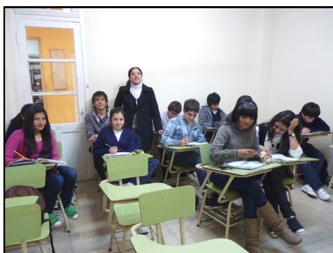
Los alumnos del Instituto de Estudios de Inglés y sus docentes quisieron estar presentes en este encuentro.

En la hermosa ciudad, en el Pasaje Zorrilla 239, se encuentra el Instituto de Estudios de Inglés (IEI) que funciona como Centro de Apoyo Tecnológico para la Universidad CAECE. El IEI tiene una trayectoria de 35 años en el campo de la enseñanza de inglés a todo nivel y ofrece también exámenes internacionales y viajes de estudio al extranjero.