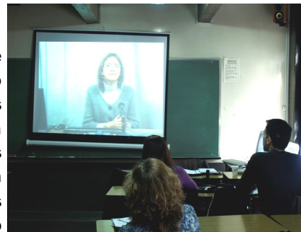
Alumnos y docente en una clase virtual de Informática Educativa, en la U.CAECE

La clase virtual genera incertidumbre y hasta cierto temor. Por eso, capacitamos a nuestros docentes para este desafío y les brindamos el apoyo del Prof. García Echarri.