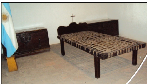
La habitación donde se alojaba el Gral. San Martín en el convento de San Juan.

En ese momento, nos preguntamos si hay relación entre la grandeza y la humildad. No encontramos respuesta, pero salimos enriquecidos por habernos planteado la pregunta. Eso, tal vez, sea parte del legado del Gral. San Martín.