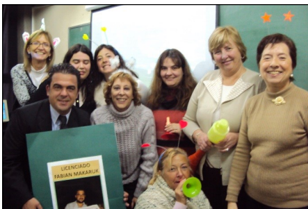
Hasta cotillón, al recibirse.

A veces en forma espontánea, a veces al contestar las encuestas, nuestros alumnos nos hacen llegar sus opiniones. Publicamos aquí algunas y nuestros lectores no deben pensar que ocultamos las negativas, sino que no tenemos opiniones completamente negativas. Aun cuando nos señalan algún defecto a corregir, nuestros alumnos siempre elogian el trabajo del Área de Educación a Distancia, la solvencia de los docentes y la organización de la Universidad.