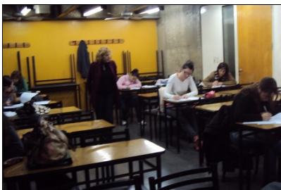
Exámenes: pasos hacia adelante.

Elegiría mil veces estudiar a distancia en esta universidad.