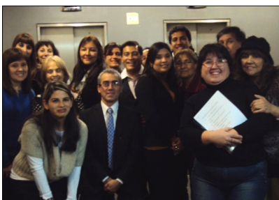
Graduados, familia y tutores.

Nos han dicho, al finalizar el primer cuatrimestre: