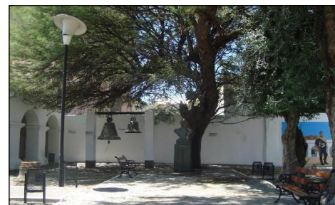
Campanas del convento que anunciaron la primera victoria del Libertador, y árbol de 300 años.