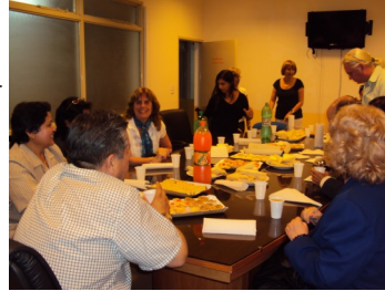
Almuerzo en la Universidad Nacional de Río Cuarto, con colegas de Brasil, Cuba, Ecuador, España y Argentina.

encuentran publicados en http://www.caece.edu.ar/distancia/investigacionypublicaciones.htm