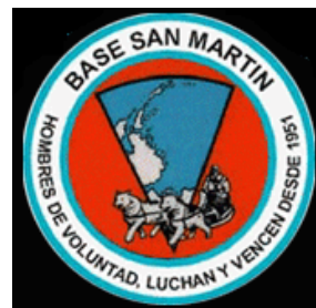
Logo de la Base San Martín, donde viven y trabajan nuestros alumnos

Para llevar a cabo los estudios universitarios con modalidad a distancia, es imprescindible tener voluntad, cierta sistematicidad y ser capaz de autogestionar los tiempos. La Universidad CAECE sabiendo de estos requerimientos, pone a disposición de los estudiantes una serie de estrategias que ayudan a los alumnos a alcanzar sus objetivos, desde cualquier lugar donde residan.