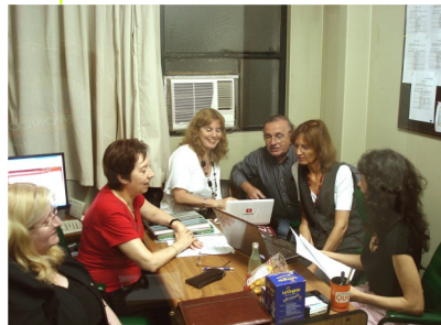
Reunión semanal del Área de Educación a Distancia