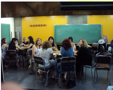
Nuestros tutores y los miembros del Área, en su reunión de trabajo. Diciembre 2010.