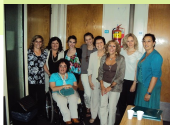
El día de la presentación de trabajos finales en febrero de 2011: graduados, tutores, la coordinadora de Pehuajó y miembros del Área