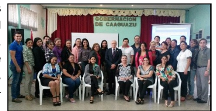
Inicio de clases en la U.N. de Caaguazú

de Presupuestos Mínimos de Protección Ambiental de los Bosques Nativos, de la Dirección de Bosques, entre colonos, maestros y otros miembros de la comunidad.