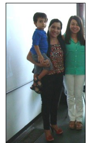
Un muy bienvenido pequeño acompañante.