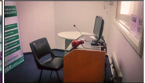
La nueva cabina de emisión .