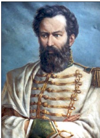
Gral. Martín Miguel de Güemes

El 17 de junio de 1821 moría Martín Miguel de Güemes, el líder de la Guerra Gaucha, el que había tomado con su caballería un buque inglés varado, durante las Invasiones Inglesas; el que peleó con San Martín y Belgrano. Tenía 36 años.