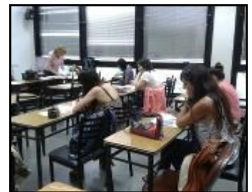
Volvemos a las aulas, virtuales y de ladrillos.

Al comenzar el año, invitamos a los colegas a examinar la tecnología para crear nuevas estrategias didácticas, acercarse más a los estudiantes y juntos construir nuevos conocimientos.