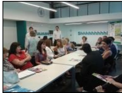
Momentos de la reunión.