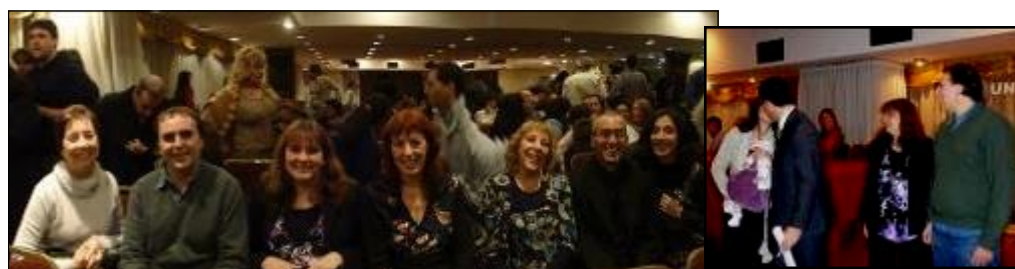
El proyecto hecho realidad: graduados, tutores y miembros del Área de EaD en una colación de grados.