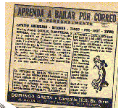
Anuncio de 1833, encontrado en Liends Weckobland