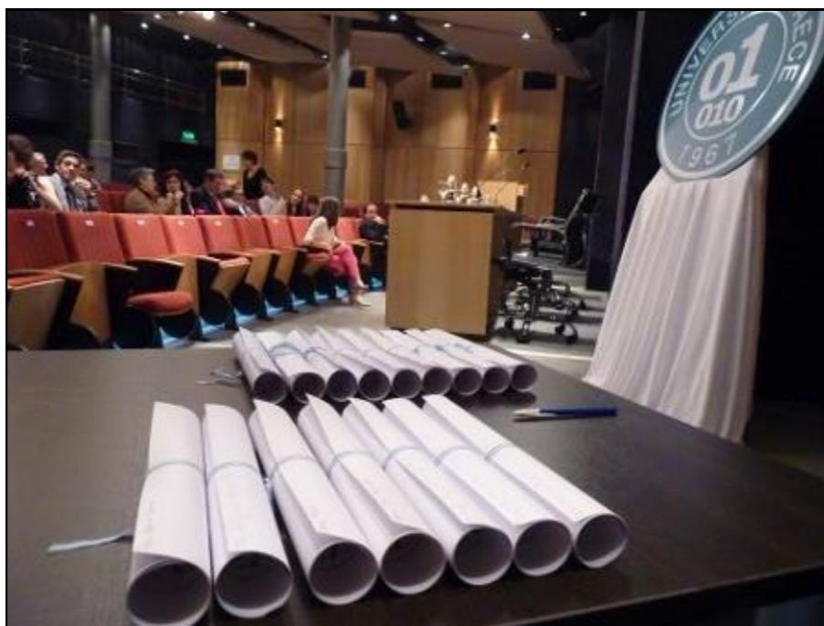
Los preciados diplomas aguardan a los egresados.