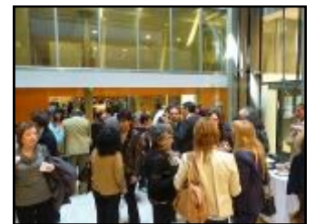
El vino de honor