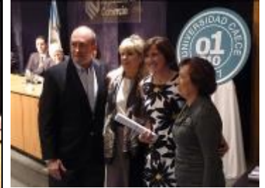
El gran momento, para toda la familia.