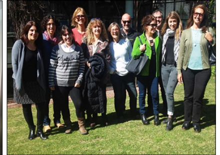
El grupo de colegas de Mar del Plata.