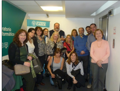
El grupo de colegas de Buenos Aires.

pus virtual. Todos estuvieron unidos por la virtualidad y juntos en la distancia.