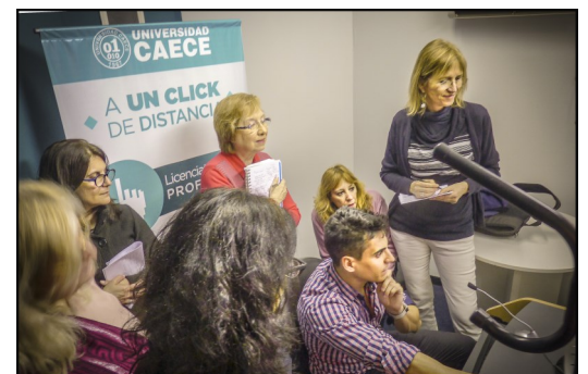
El equipo durante la capacitación.